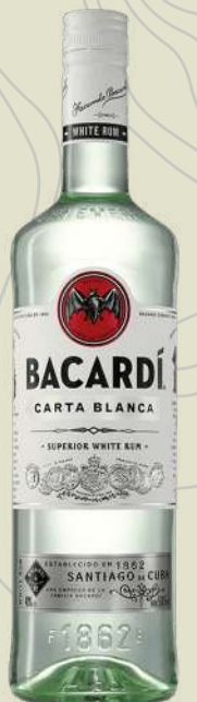
BACARDÍ CARTA BLANCA