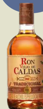
RON VIEJO DE CALDAS 1/2 bot