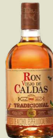
RON VIEJO DE CALDAS