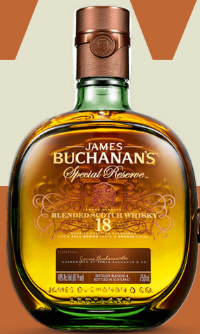
BUCHANAN'S 18 AÑOS