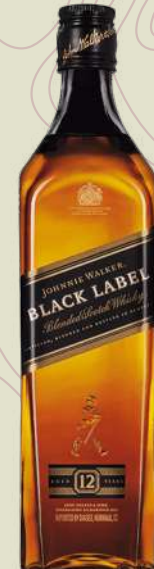
JHONNIE WALKER BLACK LABEL