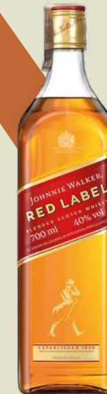
JHONNIE WALKER RED LABEL