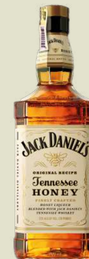
JACK DANIEL'S HONEY