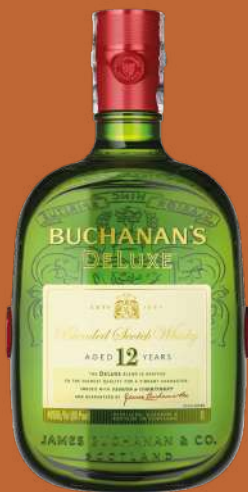
BUCHANAN'S DELUXE 12 AÑOS